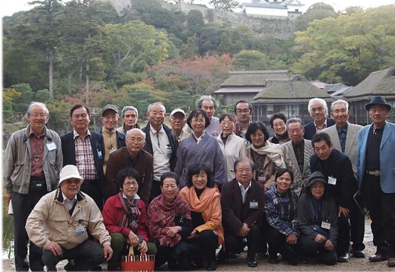
彦根城 玄宮園（大名庭園）での集合写真

彦根城の「玄宮園」に着いた時刻は午後4時前で、晩秋を思わせるような冷たい風が、身を覆いました。ご参加の皆さんは、身を丸めながら、お～寒い！バスの中に居ようかな！ところが、玄宮園に入るや否や、その景観はせつないほど美しく、言い表せないほど素敵な空間でした。