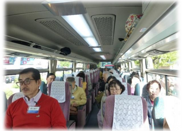
車内の様子（バスガイドの説明中）

最初の目的地は近江八幡。日本一遅い乗り物 （手漕ぎ舟）での「水郷めぐり」を体験し、「近江 八幡商人の町」を散策して日本の原風景を肌で 感じてもらおうと選んだところです。