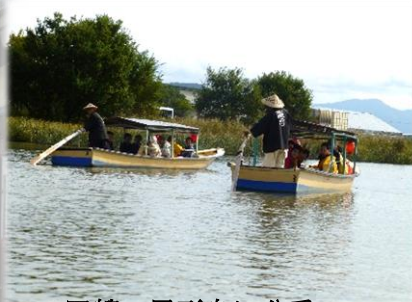
四艘の屋形舟に分乗

商人の町で驚いた光景は、建物など 「国登録有形文化財」の数というか、 広さの割に、ご案内されるブルーの 制服を身に着けたボランティアの人達 が、すごく沢山おられたことでした。