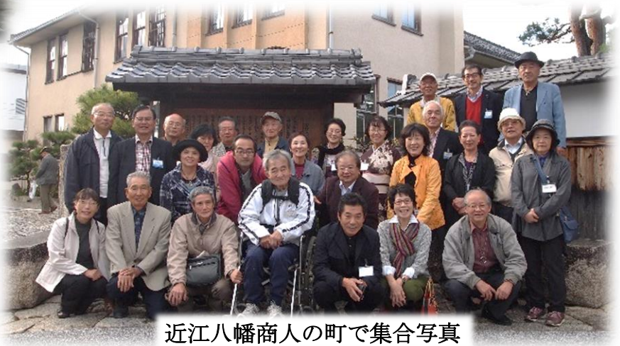
近江八幡商人の町で集合写真