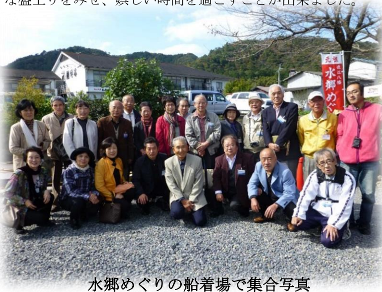
水郷めぐりの船着場で集合写真

最初の目的地は近江八幡。日本一遅い乗り物 （手漕ぎ舟）での「水郷めぐり」を体験し、「近江 八幡商人の町」を散策して日本の原風景を肌で 感じてもらおうと選んだところです。