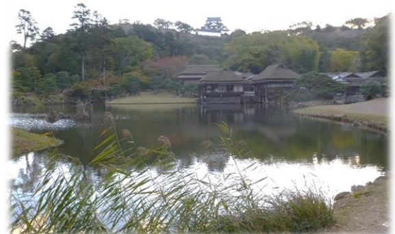
彦根城が丘の上に小さく見えます