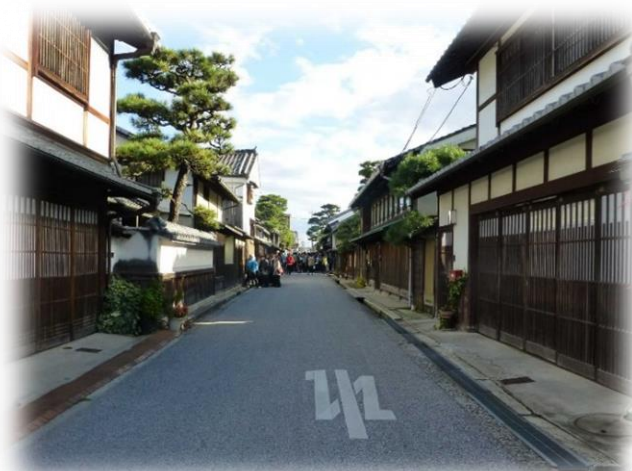
「近江八幡商人の町並み」の 一コマ

商人の町で驚いた光景は、建物など 「国登録有形文化財」の数というか、 広さの割に、ご案内されるブルーの 制服を身に着けたボランティアの人達 が、すごく沢山おられたことでした。