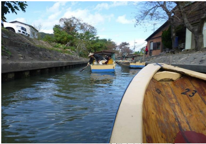
水郷めぐり しゅっぱ〜つ！