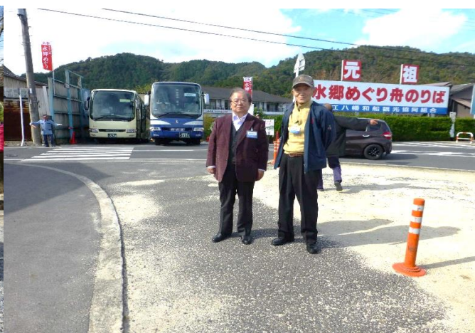
久保先輩も元気ですね！ かつこいいですよ！