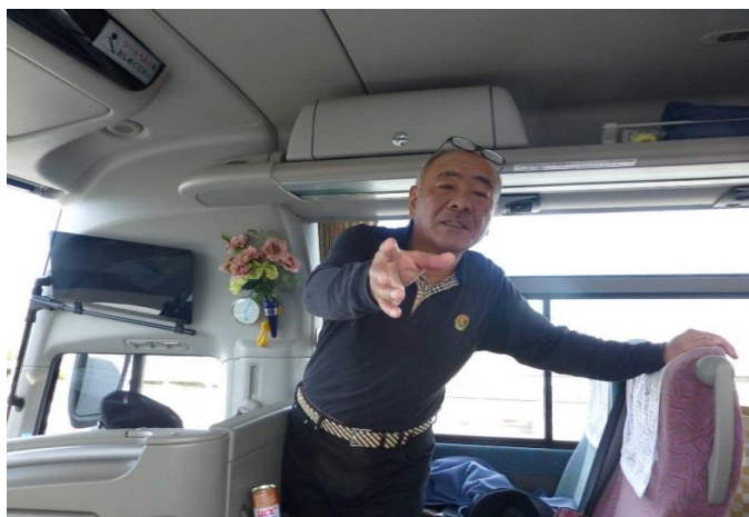
あ～あ～アーツ！また、やらかした～