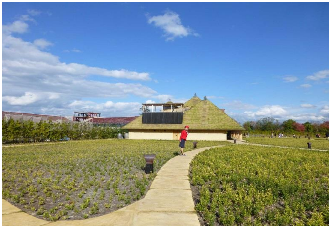
バスガイドさん たねや にごあんな〜い！