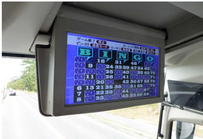
車中でビンゴゲーム、これは良かったですね！