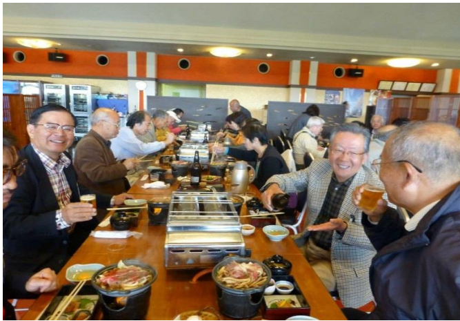
昼食は「鮎家」で近江牛すき焼き御膳