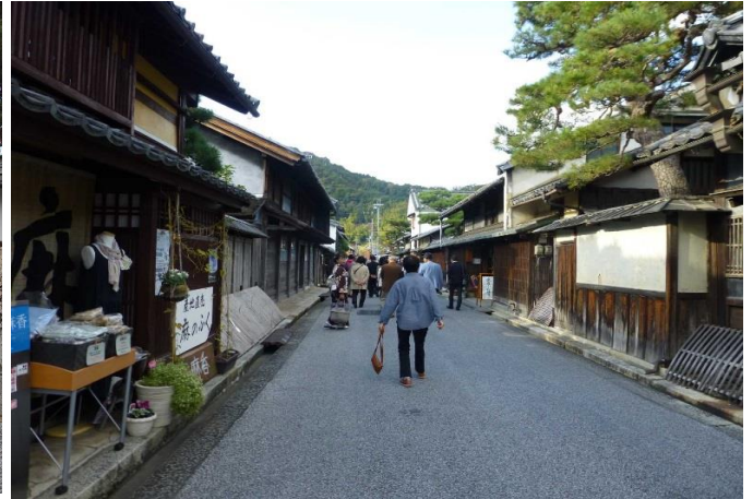
「近江八幡商人の町並み」の状況