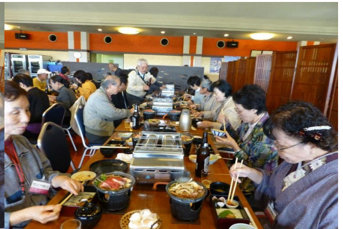
やはり、飯時は皆さん幸せないい顔してますね！