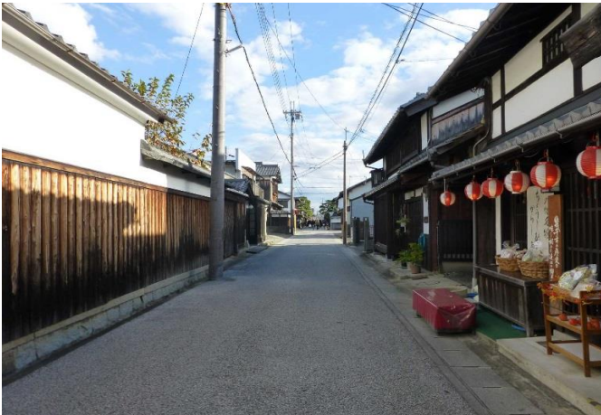
「近江八幡商人の町並み」の状況