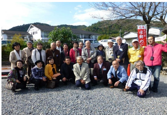
水郷めぐり乗船場で集合！