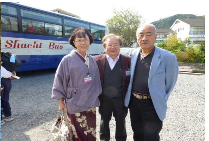
岡田さん朝パンありがと！