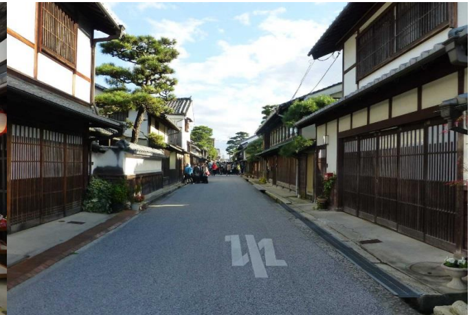
「近江八幡商人の町並み」の状況