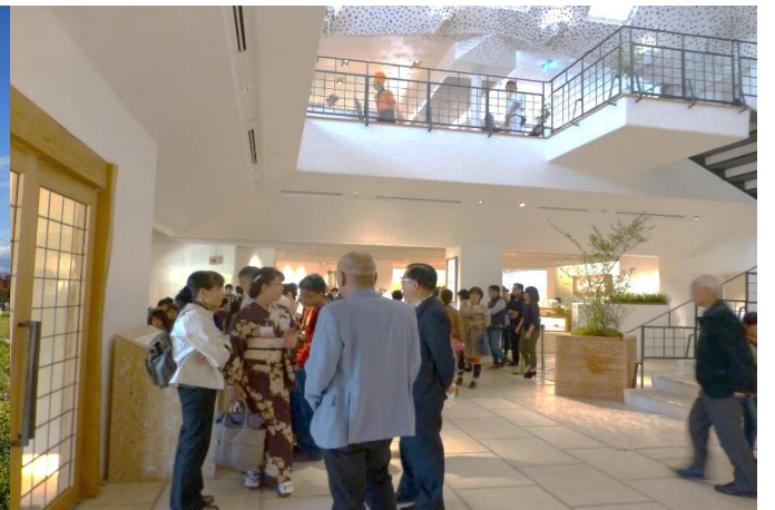
たねやでお買い物