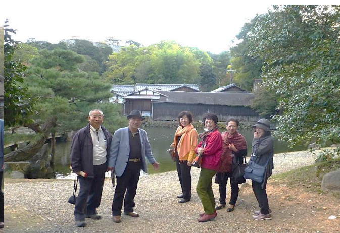
背景が良く似合いますね！