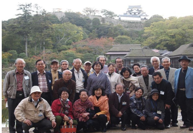
彦根城玄宮園で集合写真