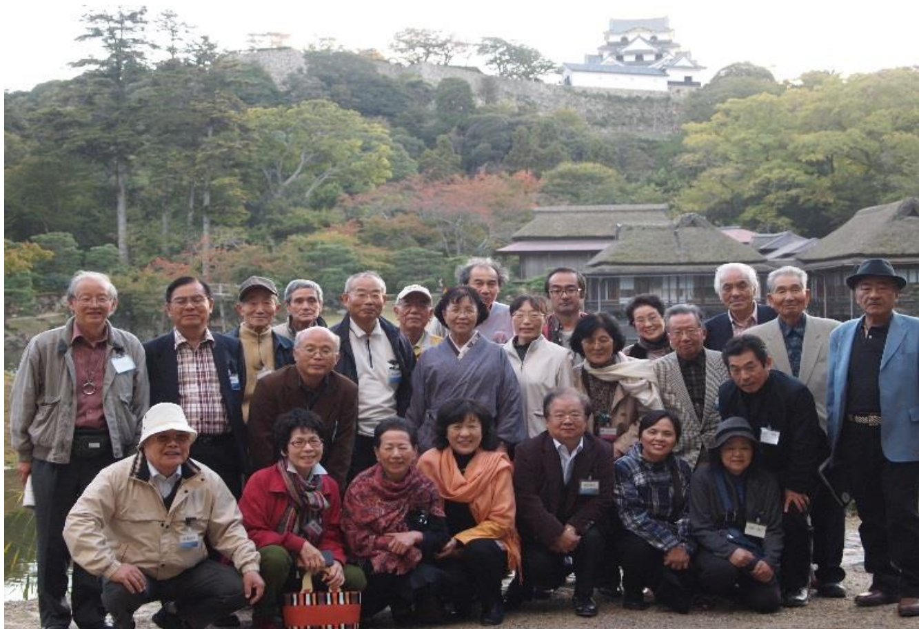
彦根城玄宮園で集合写真