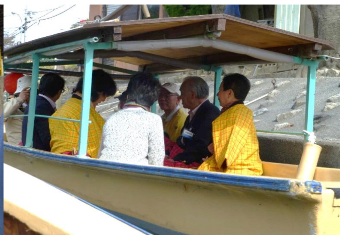
舟が沈没しなきゃいいがな～！