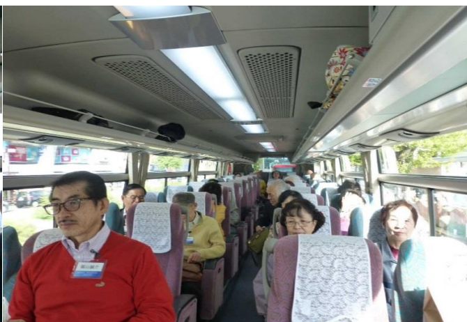
ガイドさんのご案内を聞き入る皆さん