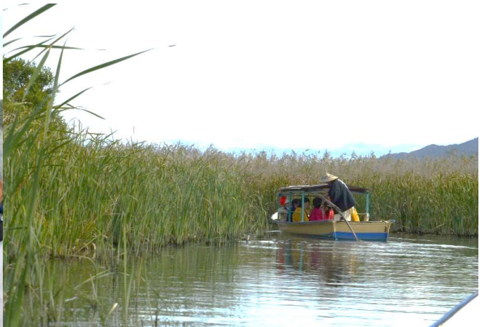
素晴らしいロケーションですね。