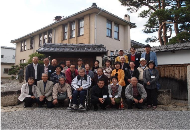
「近江八幡商人の町並み」の入り口で集合写真