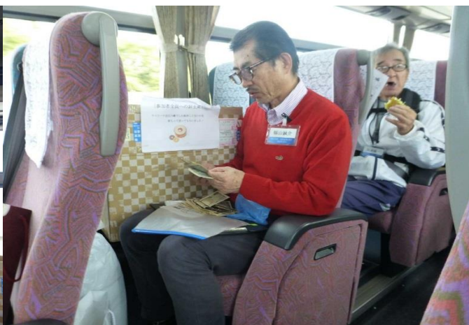
百円な～り！百十万円也！