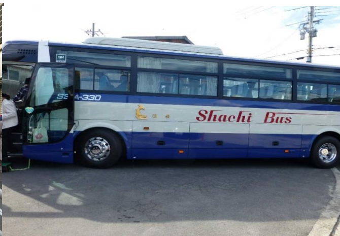
鯨バスの大型バス一番人気の「信長号」