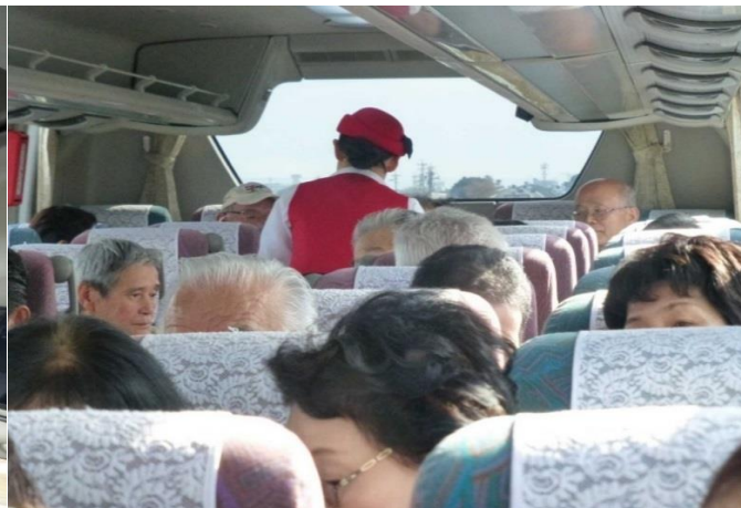
ガイドさんがビンゴゲームの景品を配っています